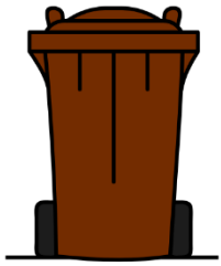
BAC BRUN (compost) matières organiques