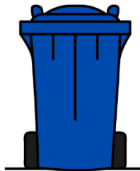
BAC BLEU récupération