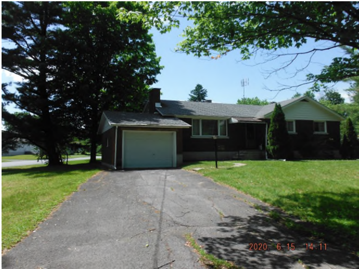
Façade actuelle de la résidence Rue Dutch