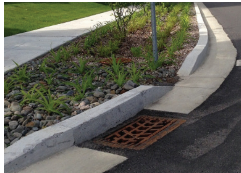
Noue de biorétention

En plus d'impliquer ses résidents dans de meilleures pratiques de gestion des eaux pluviales, la Ville de Bedford prend part à un projet pilote novateur d'infrastructures vertes dans quelques rues de la ville qui seront sélectionnées prochainement. Cette démarche permettra d'améliorer le cadre de vie des secteurs touchés par l'ajout de plantations, l'augmentation la biodiversité, en plus de gérer et de traiter les eaux pluviales sur place permettant ainsi d'alléger le réseau d'égout municipal.